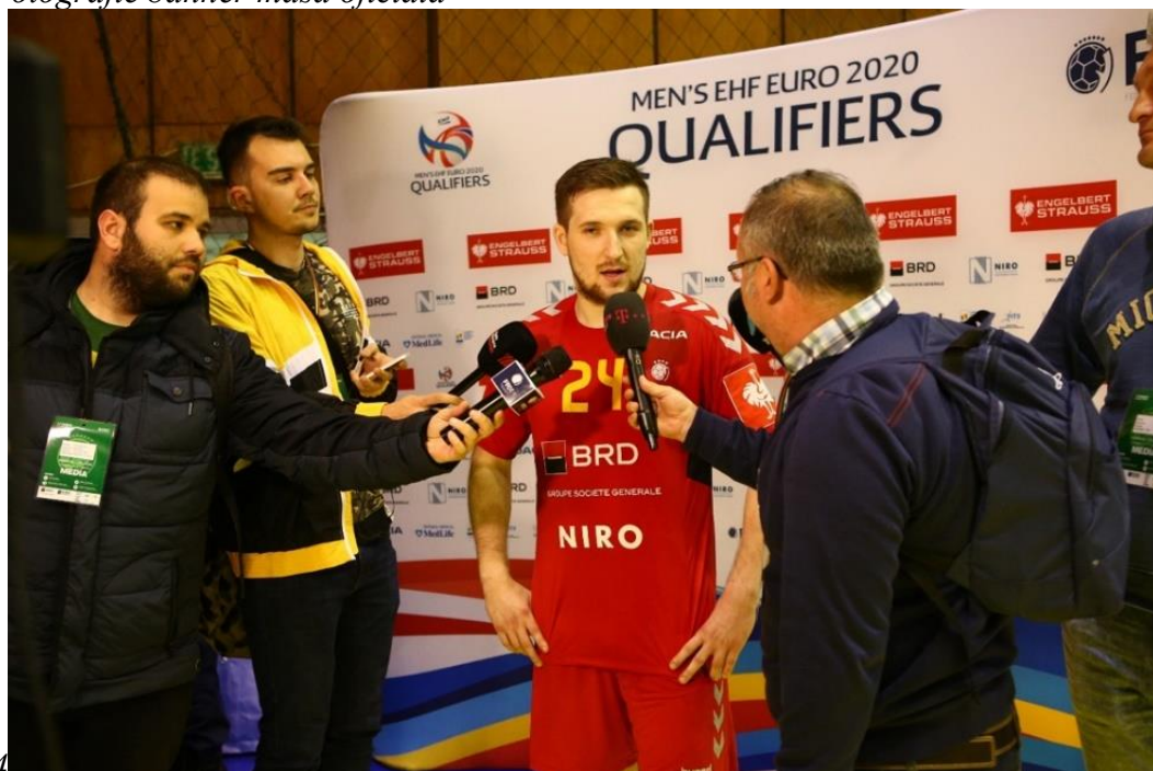
4 Fotografie panou interviuri