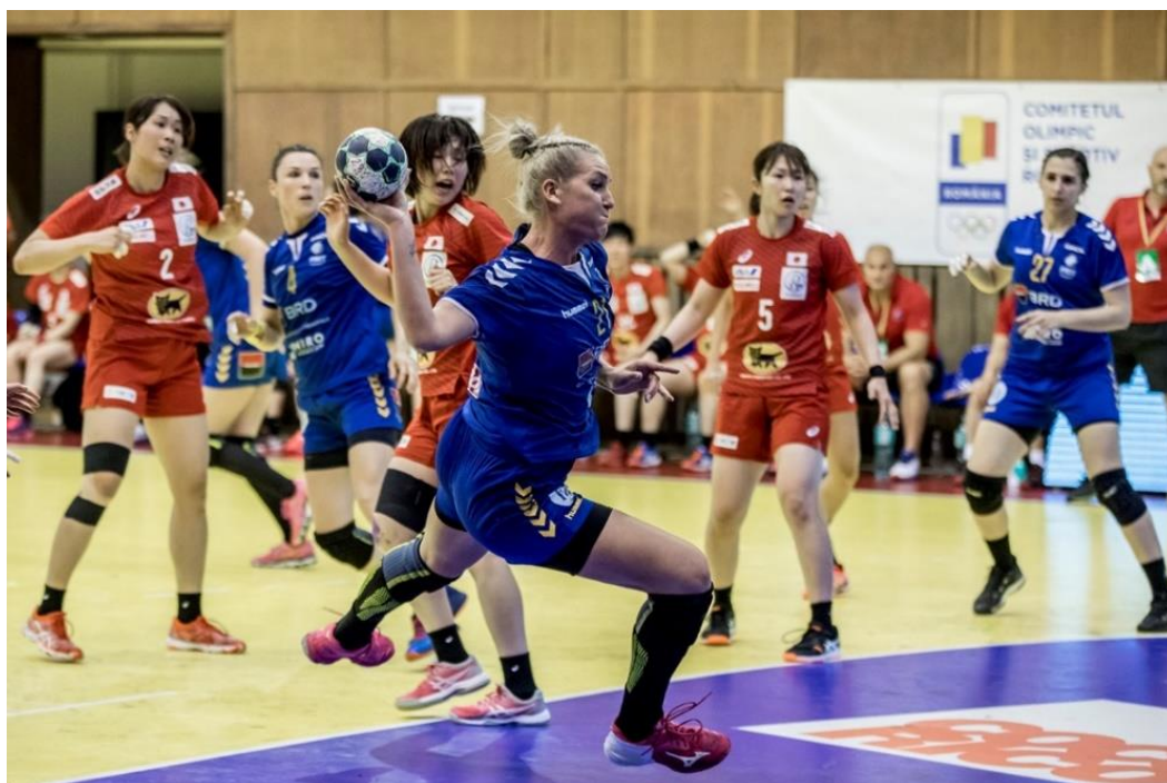
Fotografie de acțiune