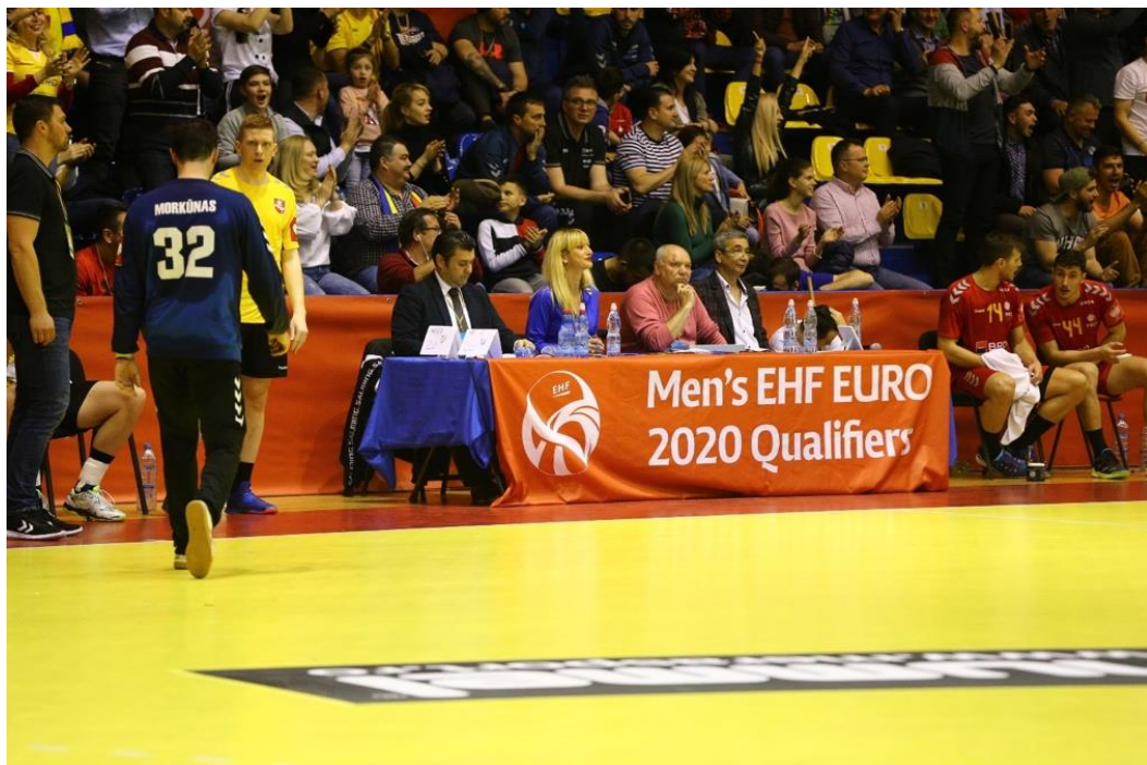
Fotografie banner masa oficială