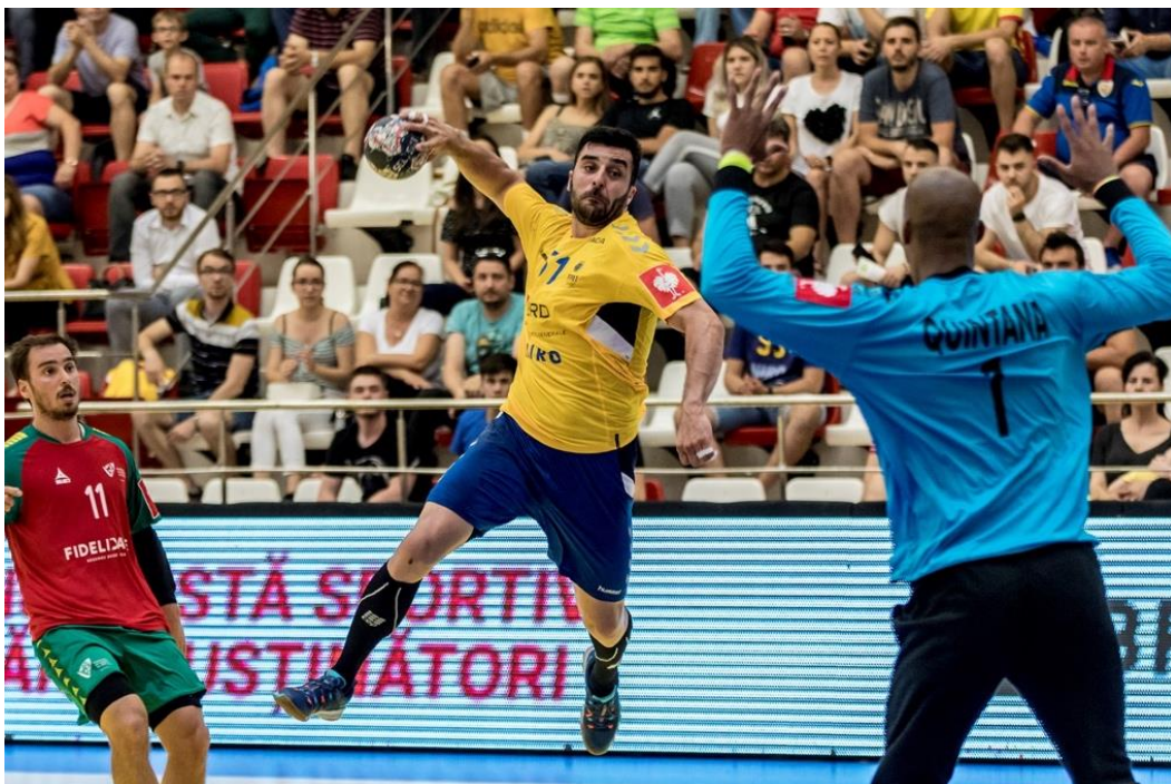
Fotografie de acțiune